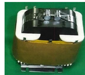
⑤ 3ES60-02U 3φ:1φ x 2 200V:(100V 0.22A) x 2 (44 VA 目安) 測定(2)SE I型 外形 FH6030BR x 2 図